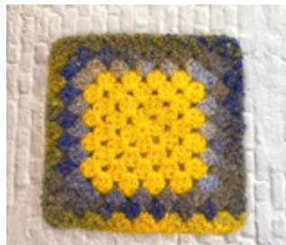
המראה בסיום סיבוב 7