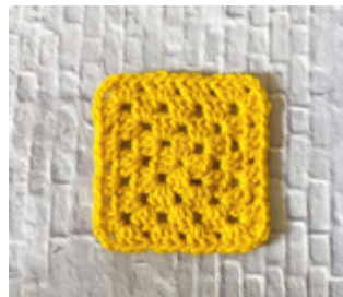
המראה בסיום סיבוב 4